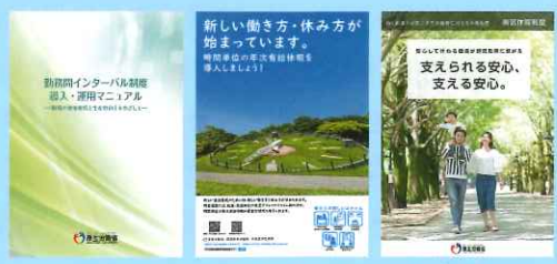
各制度に関するリーフレット(例)

「勤務間インターバル制度」「時間単位の年次有給休暇制度」「特別な休暇制度」などについて、企業の取組事例の紹介や、リーフレットなどの資料を掲載しています。自社における制度検討の参考にご活用ください。