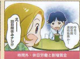
時間外・休日労働と割増賃金