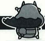
キャラクター「たしかめたん」