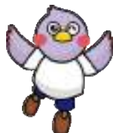
埼玉県マスコット 「さいたままっち」

午後は仕事を早上がりさせてもらって、競技と仕事の両立ができ、充実した日々を過ごしています。