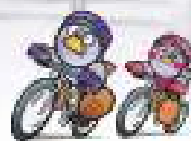
埼玉熊 mascot コバトン & さいたまっち