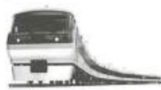
特急レッドアロー号