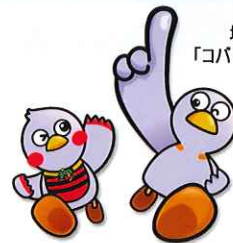
埼玉県マスコット 「コバトン」&「さいたまっち」