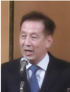
第47回 経営者協会青年部会 全国大会