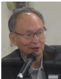
100年プランニング 株式会社 代表 (元キンビール株式会社 代表取締役副社長)