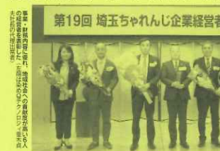
第19回 埼玉ちゃれんじ企業経営者表彰式

精密金型製作サイクル短縮 サン精密化工研究所は、精密金型製作のサイクル短縮に貢献しています。最新の加工技術と高度な品質管理により、従来の製造工程よりも短時間で高精度の金型を製作することが可能になりました。これにより、お客様の生産効率を大幅に向上させ、コスト削減を実現しています。