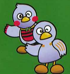
埼玉県マスコット 「さいたまっち&コバトン」