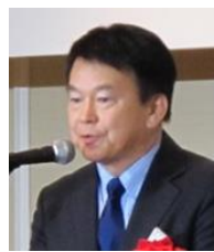
清水勇人 さいたま市長