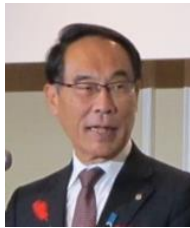
大野元裕 埼玉県知事