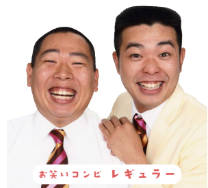
お笑いコンビ レギュラー

配信 令和6年11月1日(金) 11時から配信スタート 『埼玉県公式チャンネル(サイタマどうが)』にて配信！