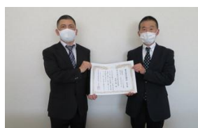
第4種無災害記録表彰