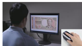
静脈認証を用いたアクセス管理