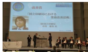
日本IE文献賞授賞式