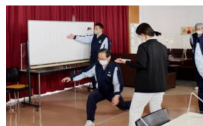
転倒災害予防研修