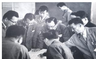
昭和初期の業務改善活動

これまでの業務改善活動の状況を論文にまとめ、日本インダストリアル・エンジニアリング協会(IE協会)が発行する論文誌に投稿したところ、特に優れた内容と評価され、「第53回日本IE文献賞(改善賞)」を受賞しました。