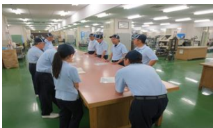
現在の業務改善活動