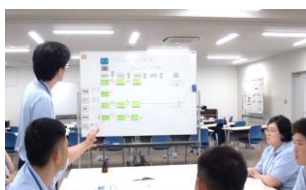
現在の業務改善活動